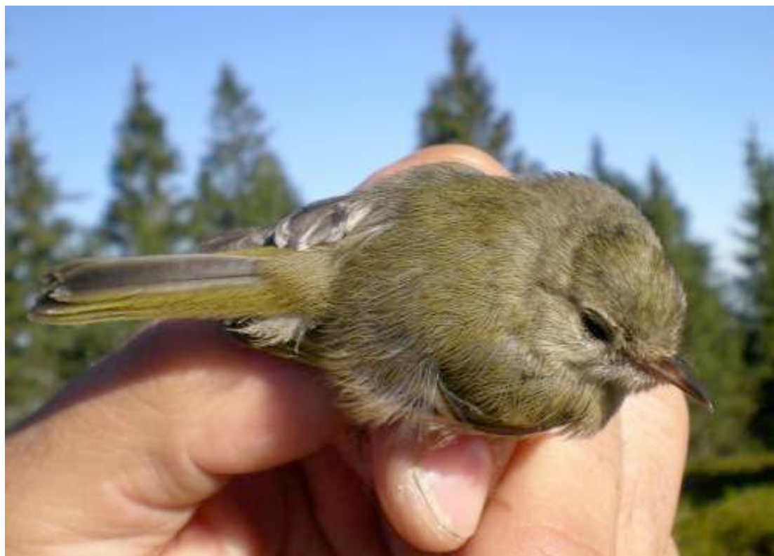
Un Roitelet huppé en plumage juvénile, fin août 2010