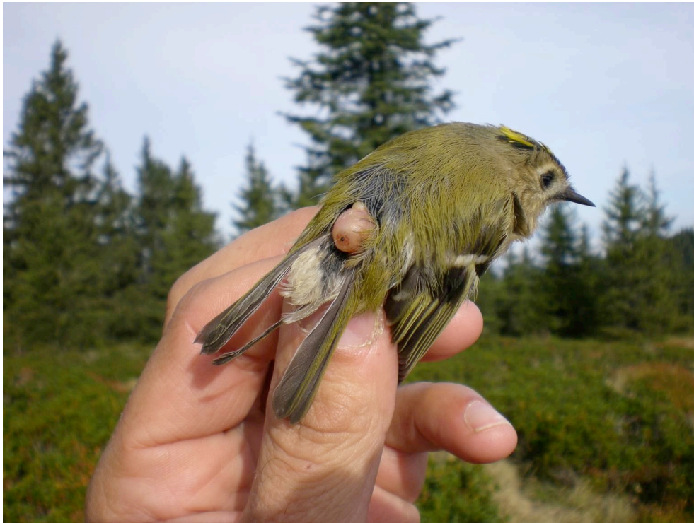
Roitelet huppé atteint du Collyriclum faba, le 12.10.2008

Les 5 espèces les plus représentées au niveau des captures sont :