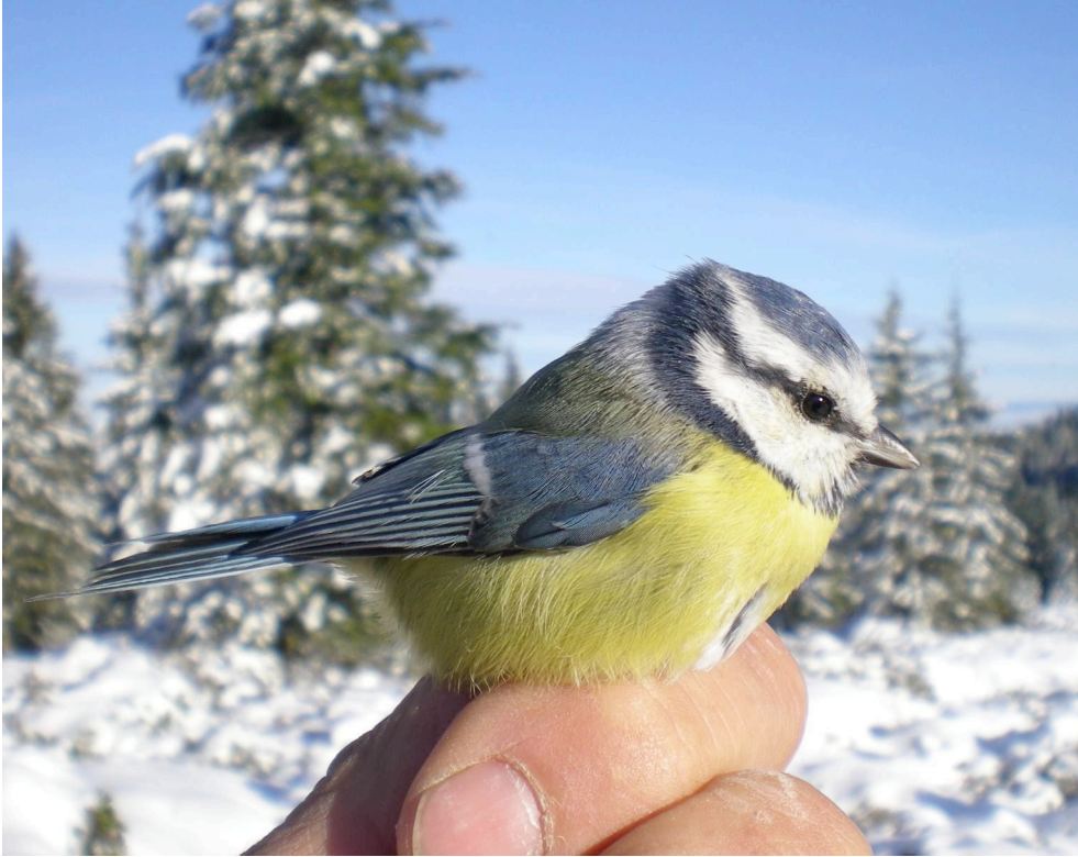
Grands passages de Mésanges bleues mais peu de captures, ici le 5.10.2008