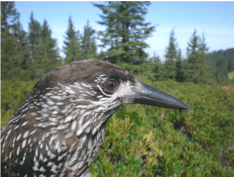
Cassenoix moucheté, le 28.9.2008