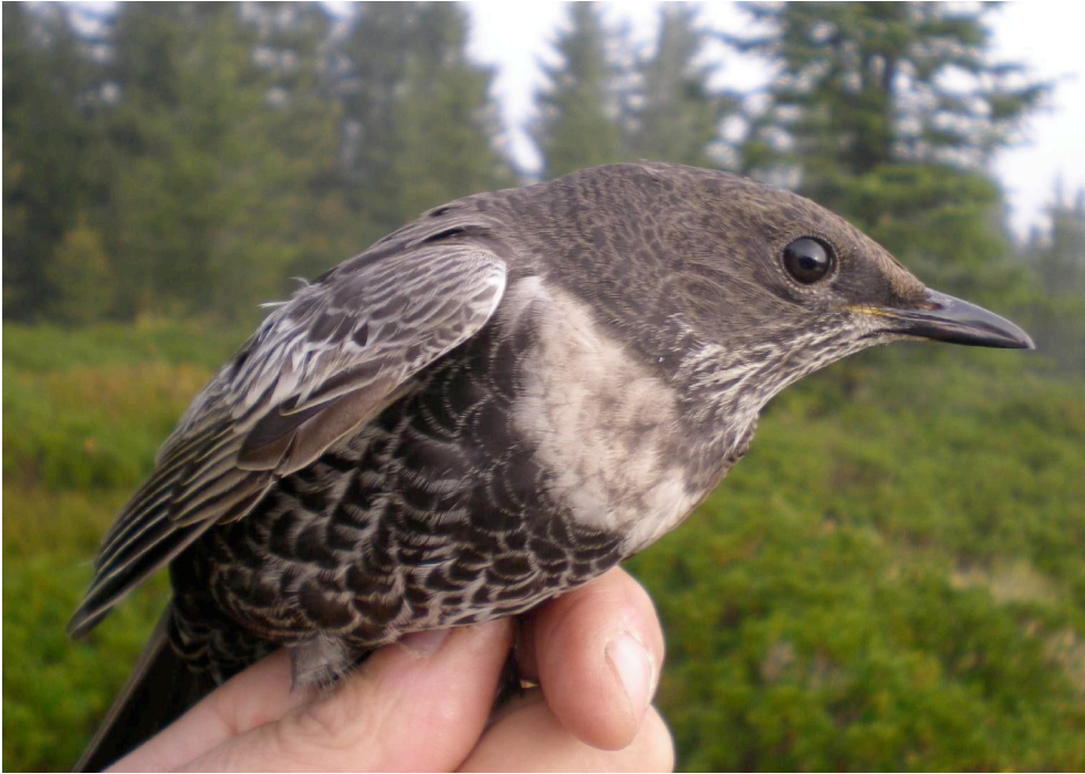
Merle à plastron alpestre, le 21.9.2008