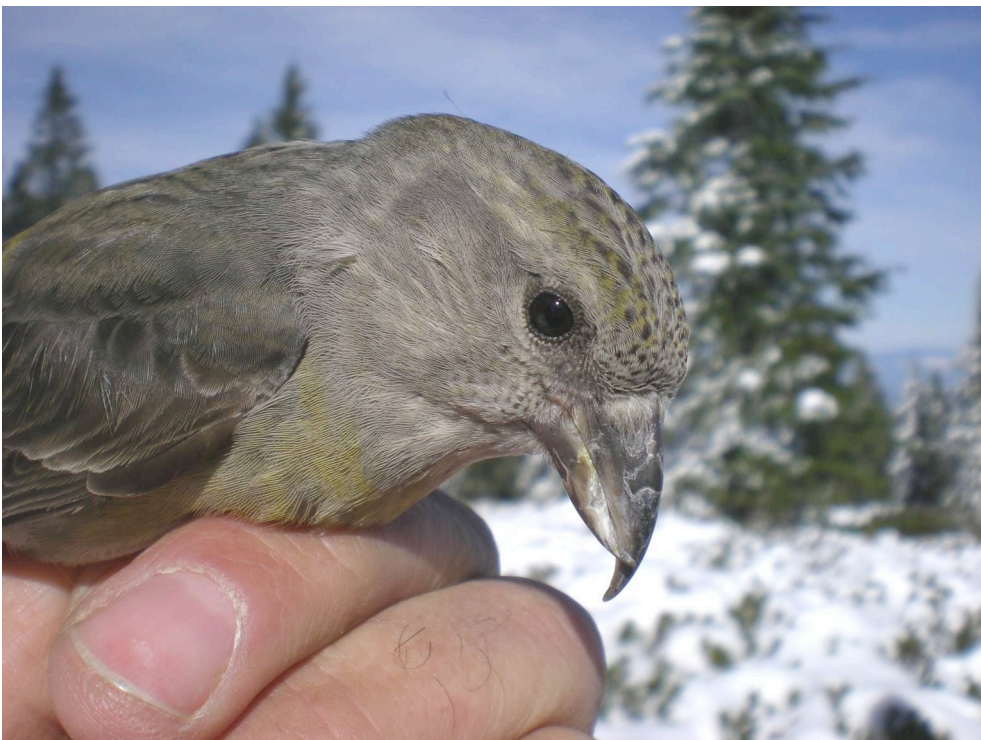
Bec-croisé des sapins le 5.10.2008